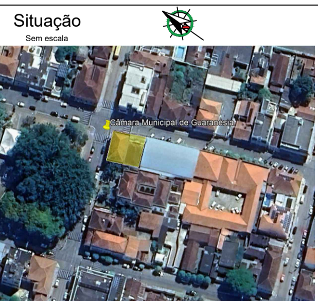
Situação Sem escala

ENDEREÇO DA OBRA Praça Dona Sinhá nº 269 - Centro - Guaraniésia - MG